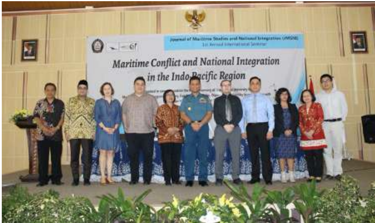
Sumber: Dokumentasi Program Studi Doktor Sejarah Fakultas Ilmu Budaya, Universitas Diponegoro

"Maritime Conflict and National Integration in the Indo Pacific Region"